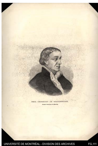
Paul Chomedey de Maisonneuve

Monsieur Paul Chomedey de Maisonneuve et Mlle Jeanne Mance sont partis en France, afin de recruter 100 soldats et leurs familles dans le but de protéger Ville-Marie des attaques Iroquoises. Aidé en cela par Monsieur de la Dauversière, nous retrouvons donc à bord les soldats et leur familles (femmes et enfants). Le navire en triste état dû faire un retour sur St Nazaire après seulement 350 lieues en mer. Il était menacé de naufrage.